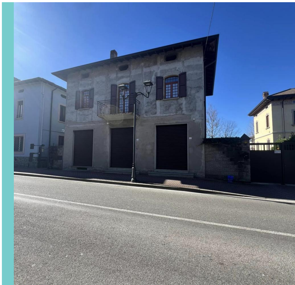
La proprietà dispone di 2 camere Superficie 191 mq