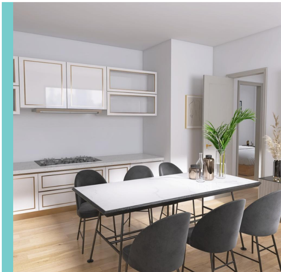
La proprietà dispone di 3 camere Superficie 120 mq