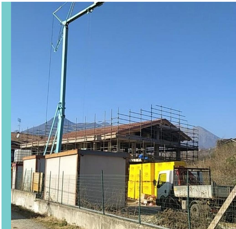
La proprietà dispone di 3 camere Superficie 105 mq